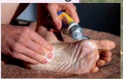
Massage du pied avec la crème anti-frottements

Pour éviter les bobos, l'essentiel est d'avoir une hygiène des pieds quotidienne. Vos ongles doivent être bien (et régulièrement) coupés sous peine de conflit avec la chaussure. Pour bien tailler un ongle, il faut respecter la courbe du doigt de pied et bien couper parallèlement à l'arrondi. Si vous avez les pieds sensibles, l'objectif est de réduire les échauffements au niveau des points de frottements dans la chaussure. Pour cela, il existe des crèmes anti-frottements type Nok Sports Akiléine® . Trois semaines avant la rando, à raison d'une fois par jour, vous devez l'appliquer sur tout le pied en insistant bien sur les zones de contacts, les plus exposées aux frottements.